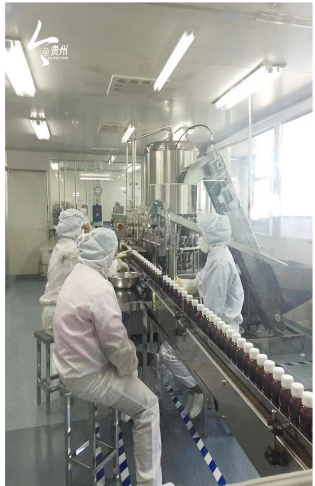
神奇制药的现代制药车间

当时的药品管理局，行政权力有限，有的工作推动起来十分吃力。在这种情况下，张芝庭每年在全国人大会议上，都要以贵州代表团名义提出有关苗药的议案，反映需要国务院解决的问题。